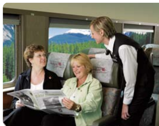
レッドリーフ・サービス