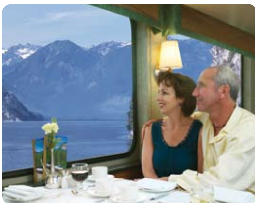
ゴールドリーフ・サービス