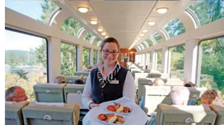
ヘリテージ展望車