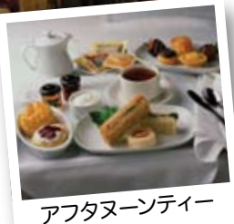
アフタヌーンティー

特別にデザインされたグレイシャードーム車両から眺める他に類を見ないパノラマの景色は忘れられない思い出となることでしょう。