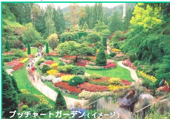
ブチャートガーデン(イメージ)

ベテラン日本語ガイドが、効率よくご案内!! 到着後は翌日のお迎えまでフリータイム ホテルは、憧れのエンプレスからお手頃ホテルまで 幅広くご用意しています。 素敵なバカンスをお楽しみ下さい!