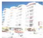
クイーンビクトリア